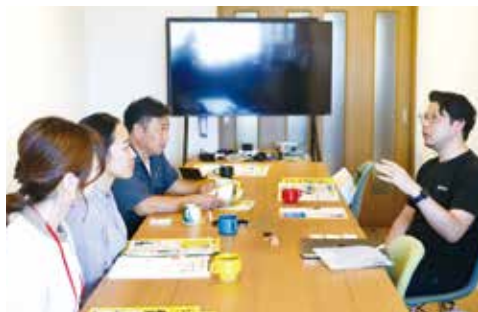
ゴム製造のお話に、興味津々です