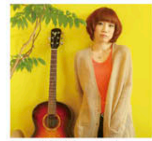
的野祥子コンサート