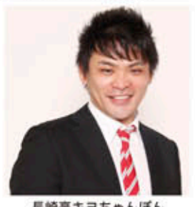
長崎亭キヨちゃんぼんステージショー

お問い合わせは、長与川まつり実行委員会 電話:883-1111(長与町役場地域政策課内)