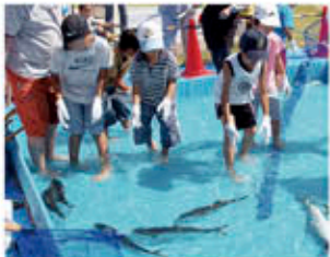
魚のつかみ取り大会