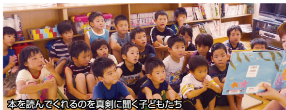
本を読んでくれるのを真剣に聞く子どもたち

夏休みも残り2週間。子どもたちはほんとに素直で元気いっぱい!! 無限の体力を持っていました。先生たちに指導を受けながら、いろんなことに一致団結して頑張っている姿がとても印象的でした。