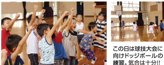
この日は球技大会に向けドッジボールの練習。気合は十分!!