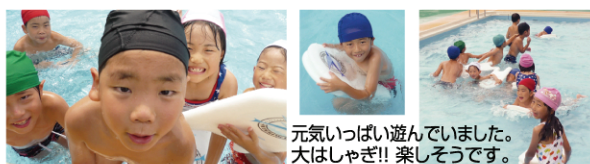
元気いっぱい遊んでいました。大はしゃぎ!! 楽しそうです。