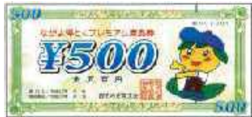
ながよ地域振興プレミアム商品券のイメージ