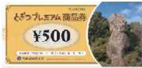
とぎつプレミアム商品券のイメージ