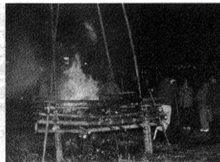
今年浦郷で行われた鬼火だきの様子

いろんな苦勞も、寒さも吹き飛ばす瞬間です。 今年も四季折々のお祭りが目白押し。みんな楽しんでがんばりましょう。皆さんの安全と健康を祈願して、「オンノホネー!」