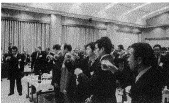
14年度新春交流会にて

近年若い経営者、女性の経営者が増えニューウェーブ旋風を巻き起こしつつあります。 年々新春交流会の「ありがた」も様変わりしていくかもしれませぬ。異業種間の数少ない交流の機会はあるにとつてまたとないチャンスです!