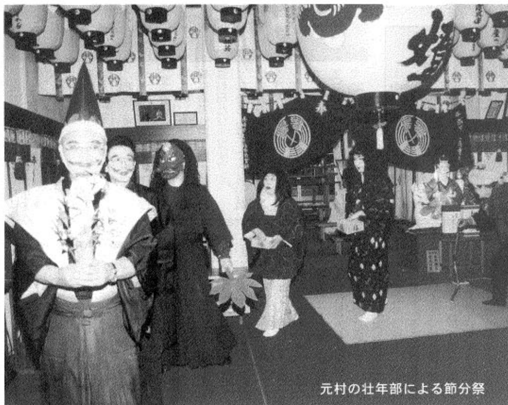
元村の壮年部による節分祭