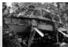
第5回 君は知っているかい? 水中翼船「はやぶさ」を!