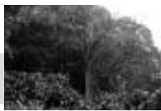
第4回 春を知らせる大山桜