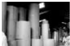
第15回 段ボールができるまで...