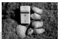
第3回 スナメリに会いに黒島へ