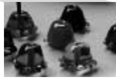
第13回 トンボ玉って知っている!?