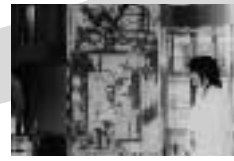
第10回 トギツにドイツを発見! ~開く?ベルリンの壁~