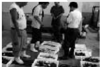
第14回 新鮮! 活魚・貝類が低価格で