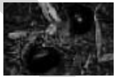
第7回 ふるさと探訪 時津の秋みつけに行こう

町民情報誌「さば」の紙面で、できる限り時津町の魅力を読者の方にご紹介しようと知恵を絞り、東奔西走しましたが、私たちがこの「さば探偵団が行く」を担当するもたぶん今回で最後です。これまでの15回の探検において、ご協力頂きました関係者の皆様に感謝申し上げます。もし、「さば探偵団が行く」の記事を読みたい方はバックナンバーがありますので、ご連絡いただければ差し上げます。