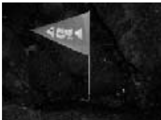
第2回 発見! 時津川の源流