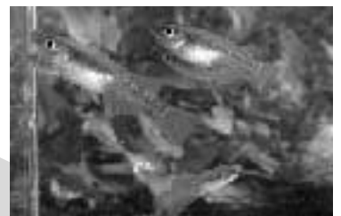
第6回 時津の川に「メダカ」はいないのか?