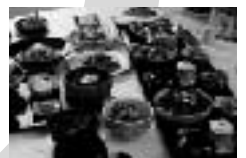
第8回 とぎつDonたく 試食会へ突撃取材!!