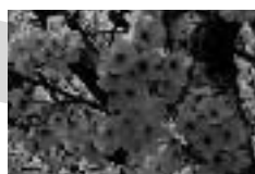
第12回 春到来 ~花見のオススメスポット~