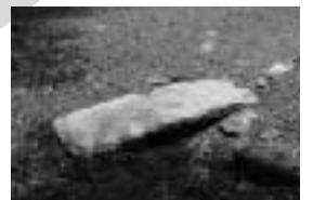
第9回 謎の古墳、前島古墳群を探る