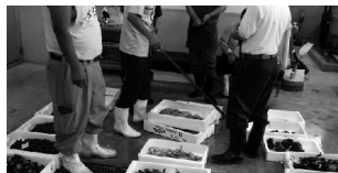
競りが始まったよ！