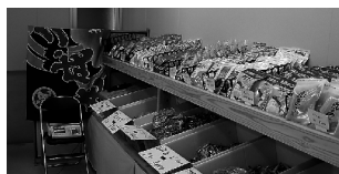
店内には沢山の乾物や海の幸でいっぱい！