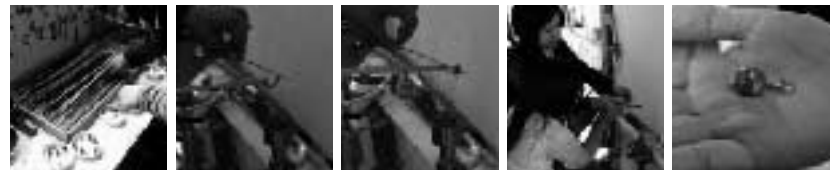
①色が多くて ②バーナーで ③ステンレスの棒に ④木下さん(左)が ⑤やっぴー！ 逃っちゃっ！ ガラス棒を溶かす ガラスをどどん 巻き付ける 最後の仕上げを キメてくれました。 感激の瞬間が！ ついに完成!!

木下奈緒美さんが開いた工房に入ると、ネックレスやブレスレット、キーホルダー等のとんぼ玉が、赤や青やピンクなど、色とりどりに光り輝いていました。よく見たら、スリッパにもかわいいとんぼ玉です。とんぼ玉は、溶けたガラスを金属の棒に巻き付け、模様などを入れて球状にしたガラス玉です。