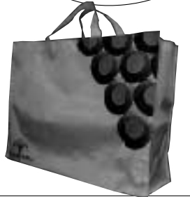
サイズ/幅450×高さ350×マチ150mm 材質/ナイロン100% 価格/840円(税込) 色/ベージュ地に紫と黒のデザイン

【販売店】 エトワール今道/とらや商店(川林)/肉肉の大川/米の蔵・酒の蔵まるやま ビューティショップやなぎはら/福森商店/梅電化プラザサークル やぎとり伸助FC時津店/九州ワーク(株)時津店/フラワーギャラリーオランダヤ ハイパーセンターオサダ時津店/とぎつスタンプ会加盟店