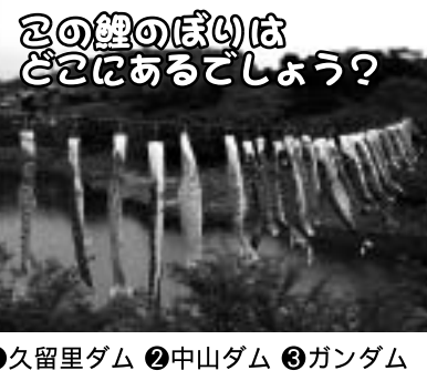
①久留里ダム ②中山ダム ③ガンダム

答えがわかった方は、さばの感想等を添えて、E-mail、FAX、官製はがきにて商工会までご応募ください。正解者の中から抽選で20名様に時津オリジナルエコバック又はふるしきを差し上げます。但し、商工会まで取りに行く事ができる方に限らせていただきます。(締切:2007年5月31日迄)