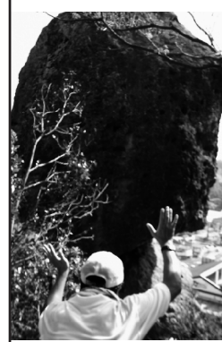
念力でさばくさらかし岩を動かすフリをするさば探偵団員!