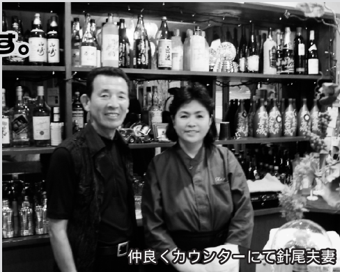
仲良くカウンターにて針尾夫妻