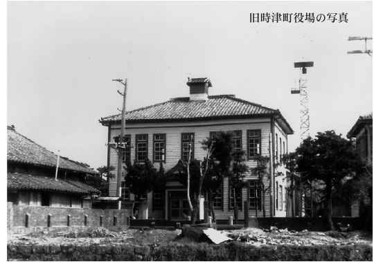
旧時津町役場の写真

昭和6年に建設をされ、昭和63年まで洋館の風情を残し時津町の行政の拠点・シンボルとして活躍しました。