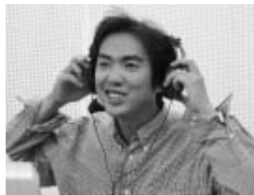
カナリーホールスタジオにてレコーディング中の大瀬良さん

Q/最後に時津の自慢、そして望む事は? A/カナリーホール最高。町の自慢だと思います。望む事は、町のイベントがもっと増えれば良いと思う。