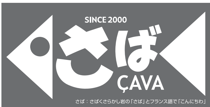
さば：さばくさらかし岩の「さば」とフランス語で「こんにちわ」