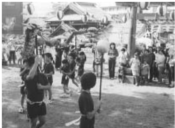
10月14日(月)に行われた時津くんちの1シーンから